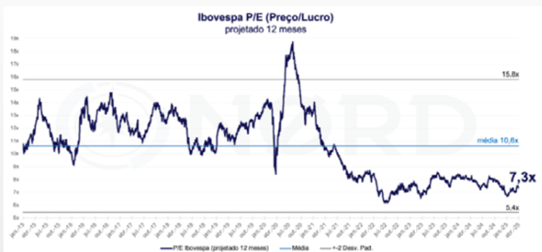
Preço/Lucro Ibovespa projetado para 12 meses. Fonte: Bloomberg. Elaboração: Nord Research.

Atualmente, o Ibovespa negocia a 7x lucros projetados para os próximos 12 meses, contra uma média de 10x. Adicionalmente, a expectativa para os resultados das empresas continua positiva.