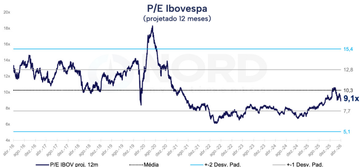
P/L projetado 12 meses, índice Ibovespa.

O ano continua sendo de expansão de múltiplos, principalmente para as ações de maior peso do Ibovespa (bancos e exportadoras). Com a forte valorização acumulada, a assimetria está menos “gritante” quando comparamos com os últimos dois anos. Entretanto, quando observamos os índices amplos ou de empresas de menor capitalização (small caps), as assimetrias continuam bastante favoráveis.