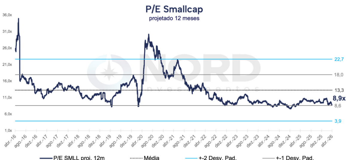
P/L projetado 12 meses, índice Small Cap. Fonte: Bloomberg. Elaboração: Nord Research.