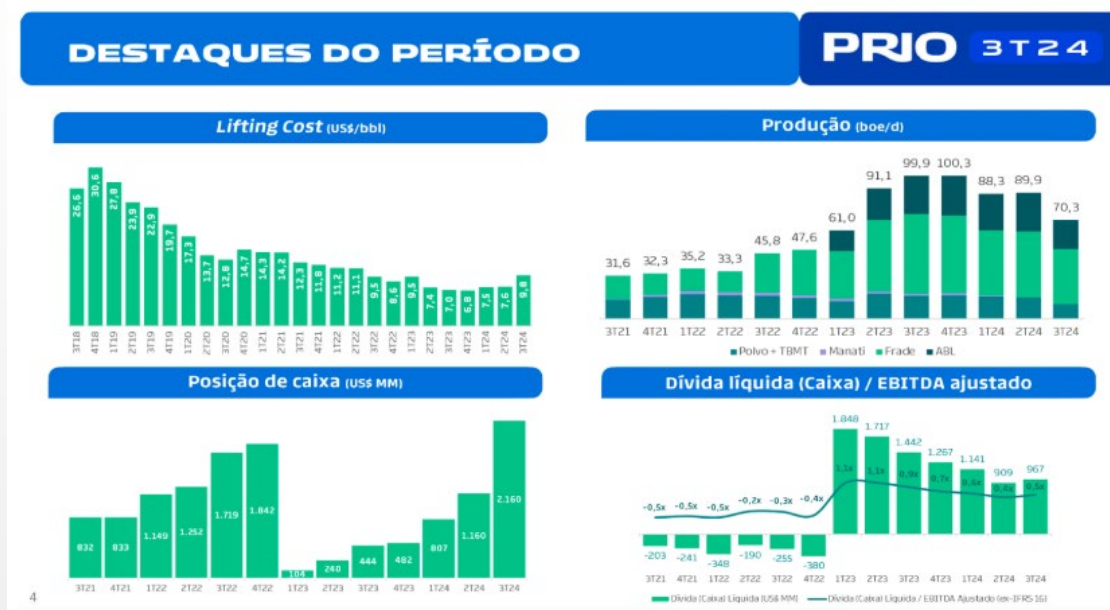
Destaques do 3T24.

Apesar de reportar o último resultado em queda e levemente pior do que o esperado, as perspectivas para a PRIO em 2025 são muito positivas. É apenas uma questão de tempo para o Ibama entregar as licenças pendentes e a empresa voltar a entregar o que está habituada (crescimento de produção e queda de lifting cost).